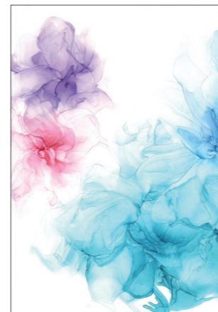
「想ふる魔法」 作者：花守 洸果

2023年版もパラリンアートの作品を採用しました。パラリンアートとは、障がい者が創作するアートを活かして、障がい者の社会参加と経済的自立を推進する活動のことです。一般社団法人障がい者自立推進機構が運営しています。