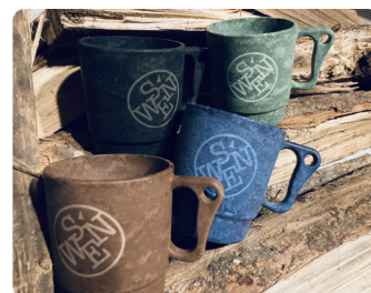
ご採用実績：アウトドアショップSWEN様 (株式会社エンチョー様) マグカップ製造元：エフピー化成工業株式会社