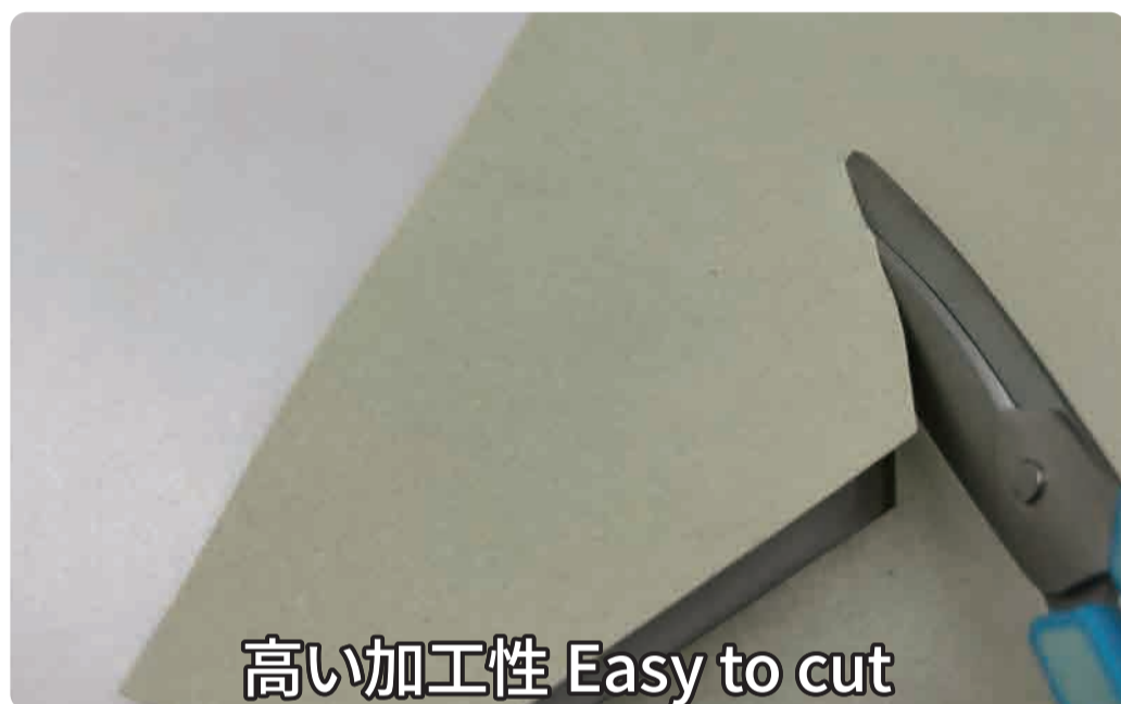
高い加工性 Easy to cut