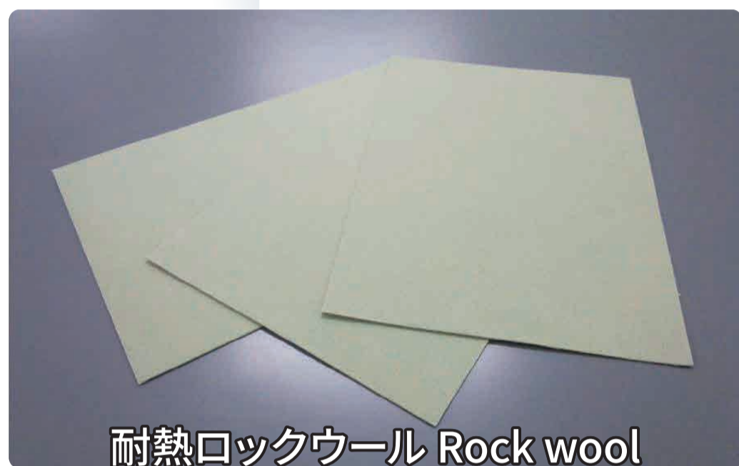
耐熱ロックウール Rock wool