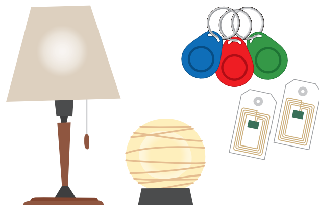
■ 環境配慮したランプシェード、ICタグなど Environment-friendly lampshades, IC tags, etc.