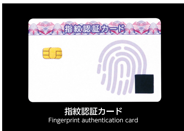
■ 高機能ICカード High-performance IC cards